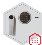
Elektronischschloss kombiniert mit mechanischer Revision